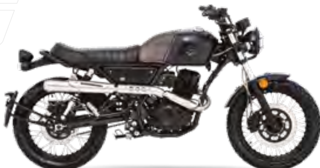
Matt-Schwarz / Bronze