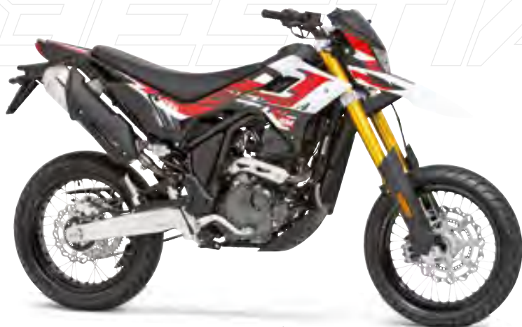
Schwarz / Rot