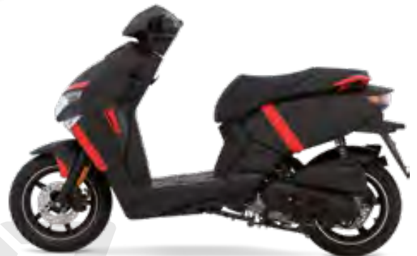
Matt-Schwarz / Rot