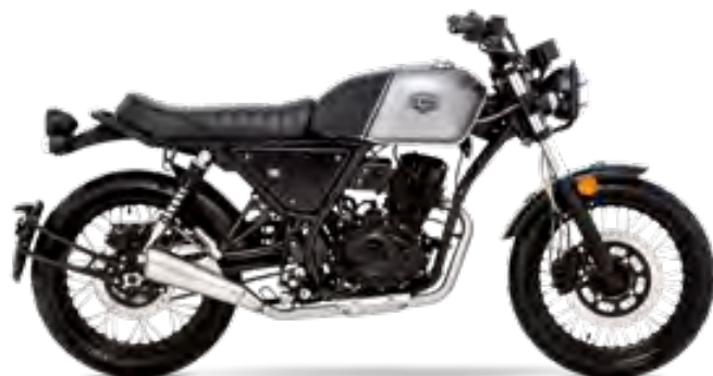
Graphitgrau / Matt-Schwarz