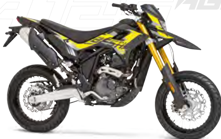
Schwarz / Gelb