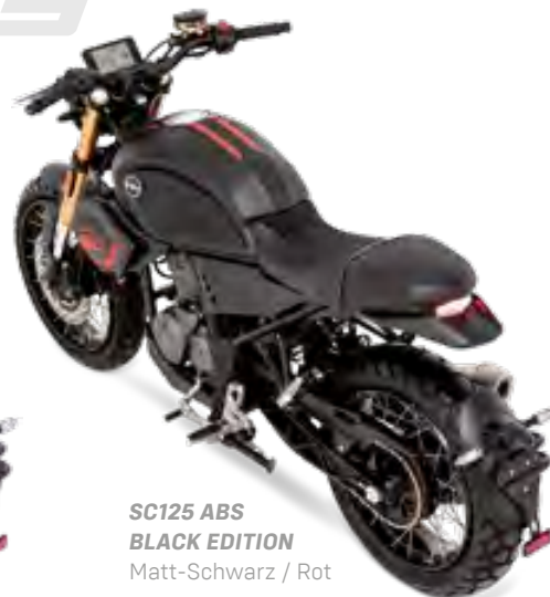
SC125 ABS BLACK EDITION Matt-Schwarz / Rot