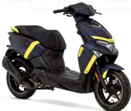
Racing-Blau Matt / Gelb